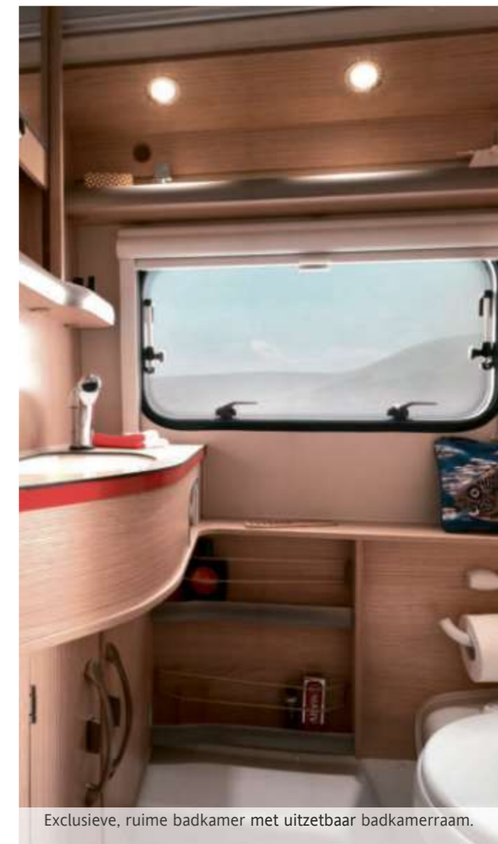
Exclusieve, ruime badkamer met uitzetbaar badkamerraam.