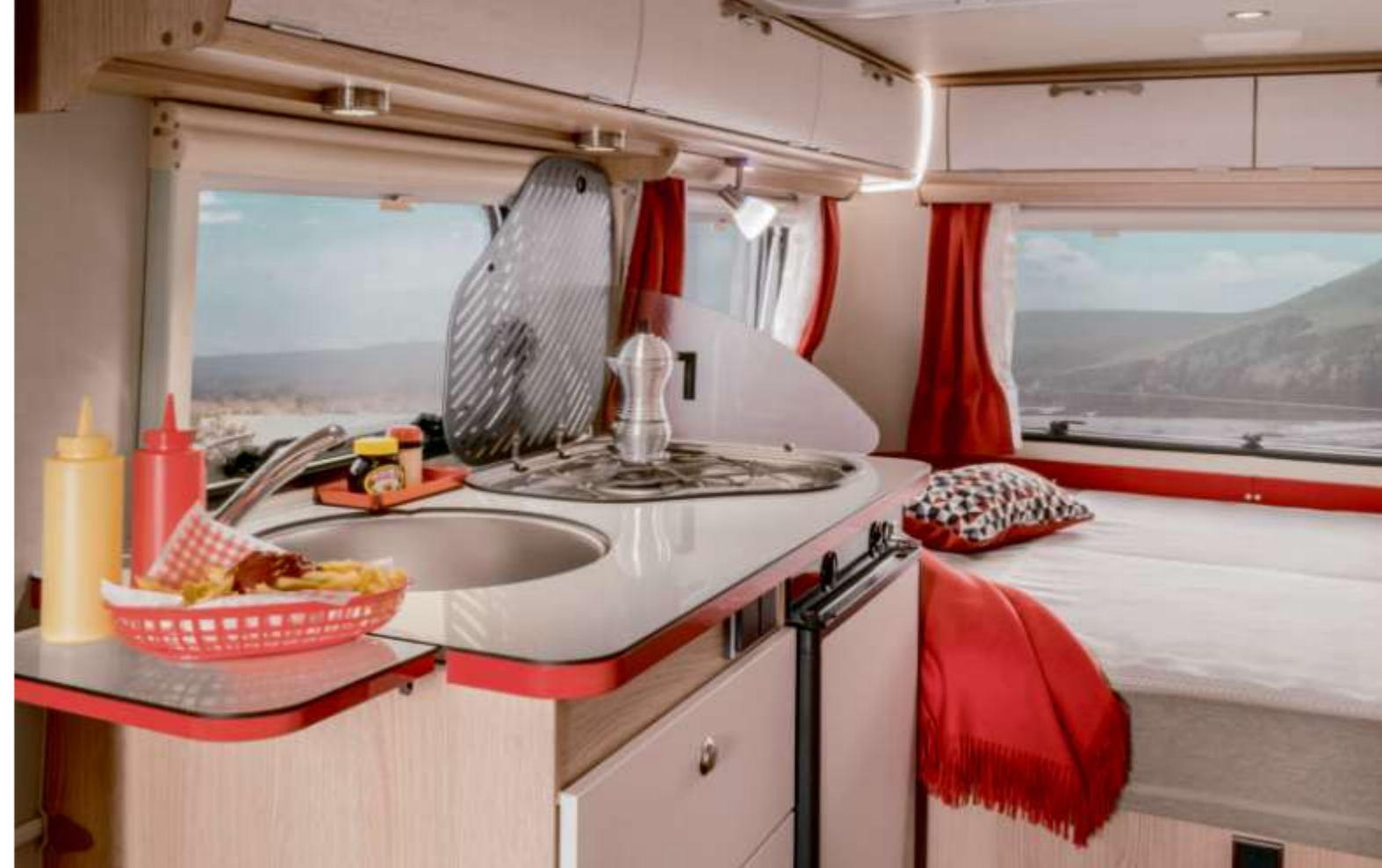
Intelligent keukenblok en klappbare verlenging van keukenwerkblad.

Reis terug naar de toekomst! In retro-chic met intelligente en technisch uitgekiende details, die niets te wensen overlaten! Het levendige kleurconcept in de keuken nodigt u meteen uit voor de charmes van een American Diner. Geniet op comfortabele kussens met een hoge rugleuning van deze uitzonderlijke levensstijl. Het exclusieve interieur in het slaapgedeelte en de badkamer maken van elke rit een onvergetelijke gebeurtenis.