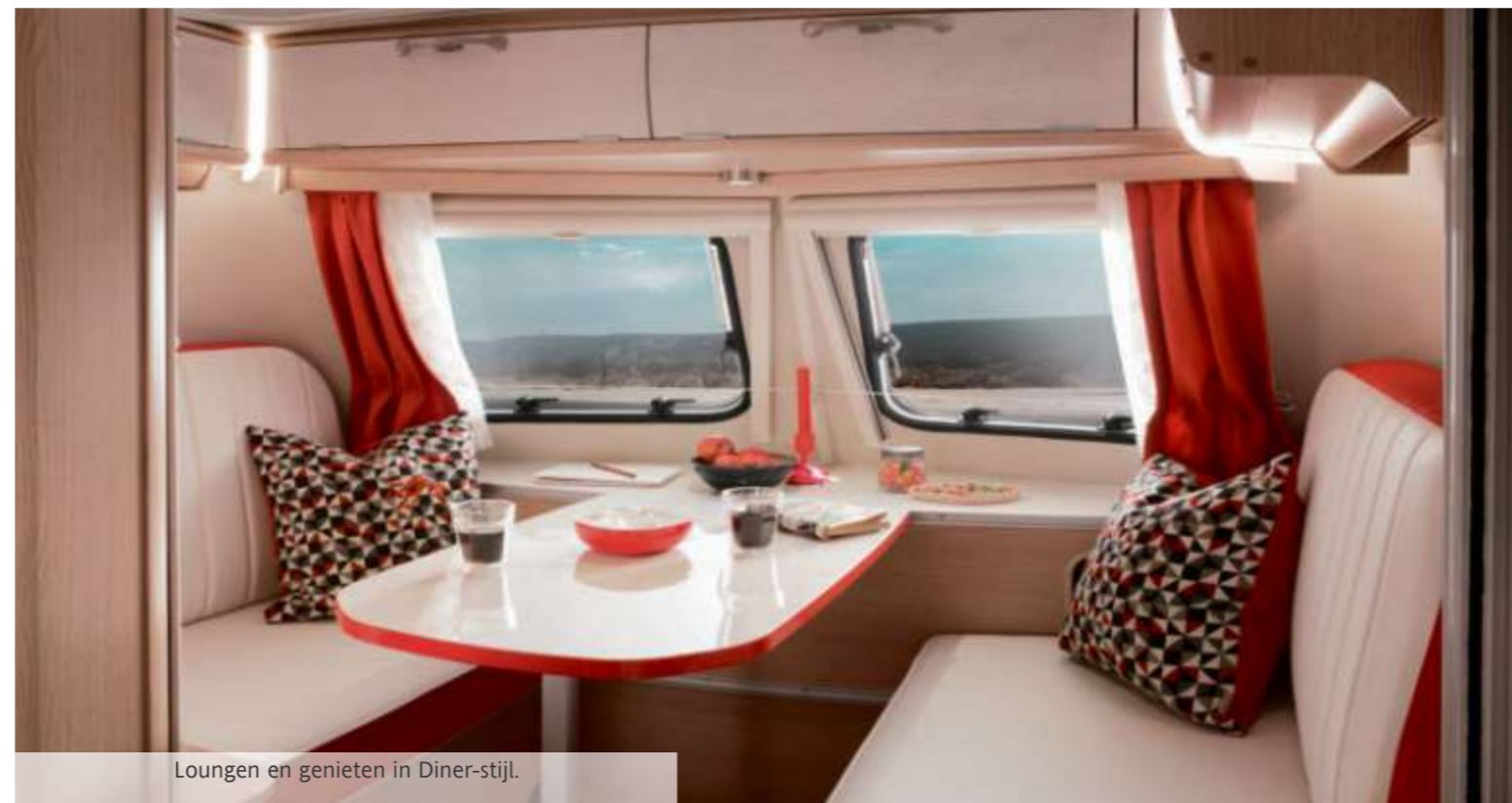
Loungen en genieten in Diner-stijl.

Deze ERIBA caravan is een ode op wieltes aan het levensgevoel en de beat van de jaren '50. Dat wordt zowel weerspiegeld in de hippe vormtaal als in het buitengewone lakwerk. Beneden rood en boven wit: zo sluit de Troll 530 Rockabilly weer aan bij het typische voertuigdesign en de kleuren van een vergeten gewaad tijdperk. Elk uitstapje wordt zo een kleine reis door de tijd.